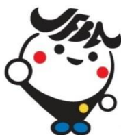
日弁連広報キャラクター ジャブくん